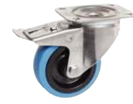
Pivotante, avec frein arrière, bleue