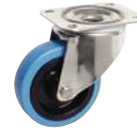
Pivotante, sans frein, bleue