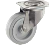
Pivotante, sans frein, grise