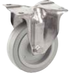
Fixe, sans frein, grise