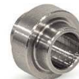
Entretoise avec centrage bilatéral