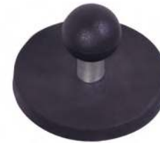
Avec poignée à boule