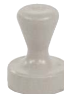
Sans œillet, gris