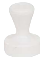
Sans œillet, blanc