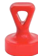
Avec œillet, rouge