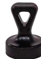
Avec œillet, noir