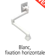
Blanc, fixation horizontale