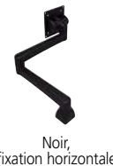
Noir, fixation horizontale