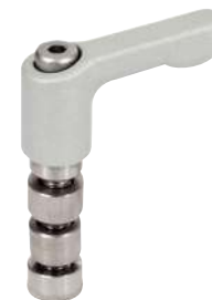
Kit manette indexable