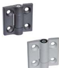
Charnière à friction