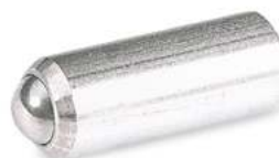
Poussoir à ressort