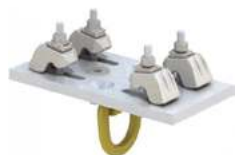
Anneau de levage articulé