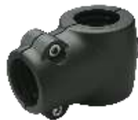
Noix de serrage en T