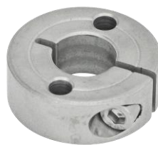
Bague d'arrêt fendue simple, inox