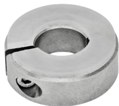
Bague d'arrêt fendue simple, inox