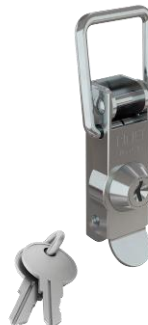
Grenouillère à crochet acier ou inox