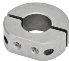
Bague d'arrêt fendue double, inox