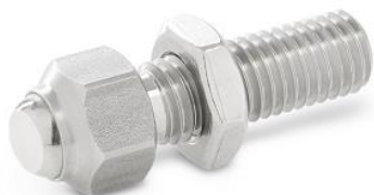
Vis de pression acier ou inox