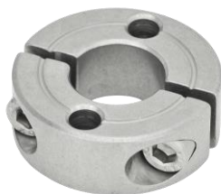
Bague d'arrêt fendue double, inox