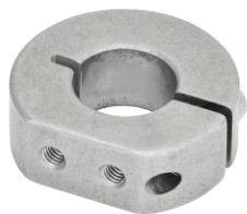
Bague d'arrêt fendue simple, inox