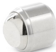
Patin de pression