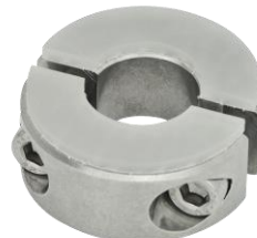
Bague d'arrêt fendue double, inox