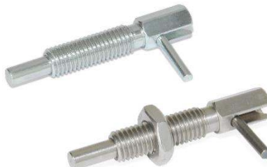
Doigt d'indexage à pas métrique, avec dispositif de blocage et levier