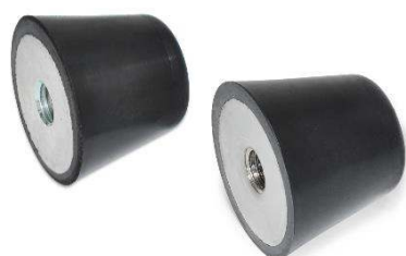
Plot anti-vibratoire conique à bout plat