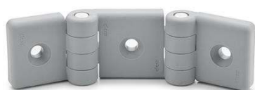
Charnières doubles pour profilés