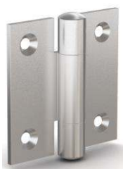
Charnière percée, nœud à plat