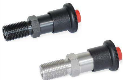
Doigt d'indexage à bouton de sécurité, verrouillage position rentrée