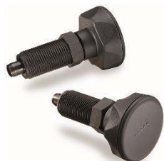
Doigt d'indexage technopolymère