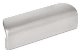
Poignée déportée inox