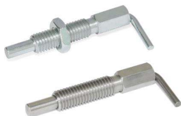
Doigt d'indexage à pas métrique, à levier