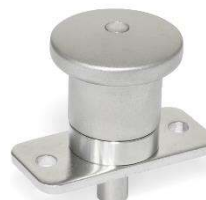
Doigt d'indexage miniature