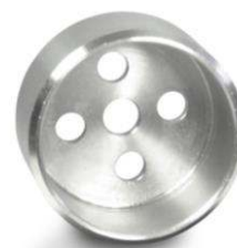
Boîtier de positionnement, pour disque d'indexation