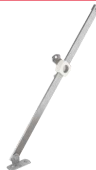
Coulisseau télescopique à déverrouillage manuel