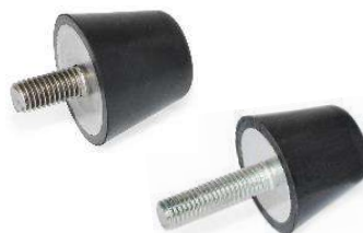
Plot anti-vibratoire conique à bout plat