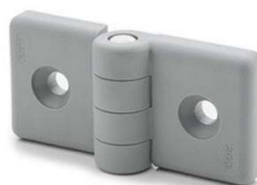
Charnières pour profilés