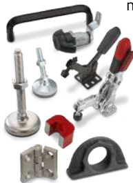
Composants normalisés Émile Maurin livrés à J+1.

métallier trouvera à la fois des charnières, loquets, poignées, pieds de machines ou sauterelles chez un seul fournisseur, en ayant le choix des