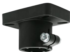
Embout de tube technopolymère