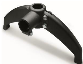
Support avec renvoi, à deux appuis