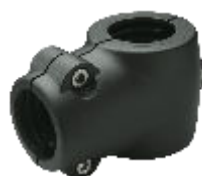
Noix de serrage en T