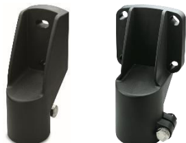
Embout de tube technopolymère