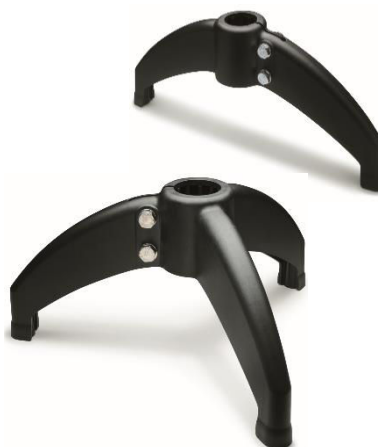
Support à deux ou trois appuis