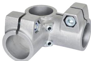
Noix de serra d'angle